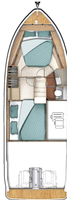
LOWER DECK optional