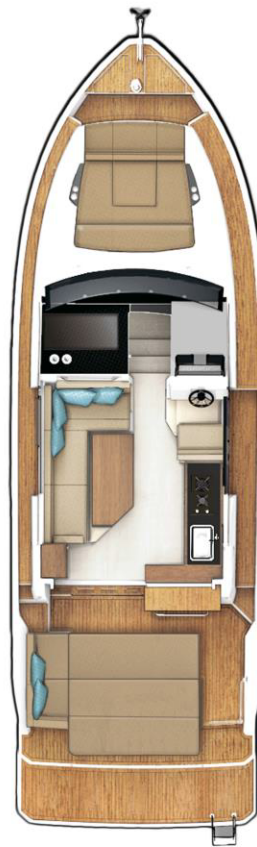
MAIN DECK optional with cockpit table to be transformed into sunpad and extended bathing platform