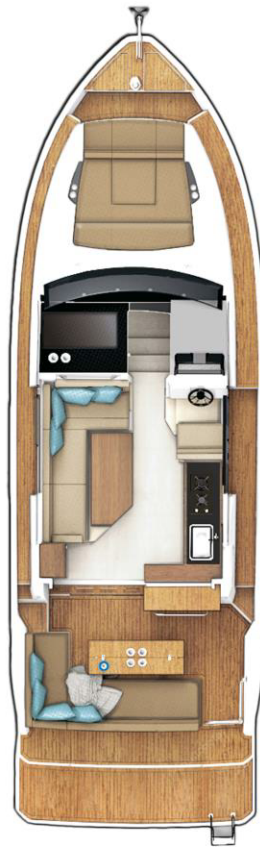
MAIN DECK optional with fixed cockpit table and extended bathing platform