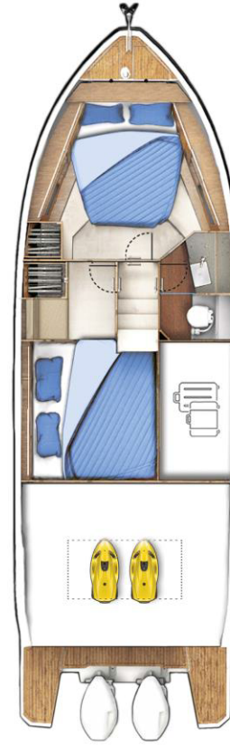
LOWER DECK optional