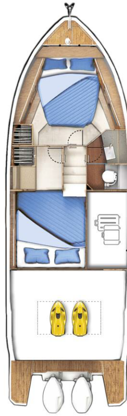
LOWER DECK standard