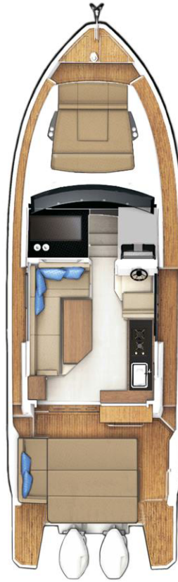
MAIN DECK optional with cockpit table to be transformed into sunpad and extended bathing platform