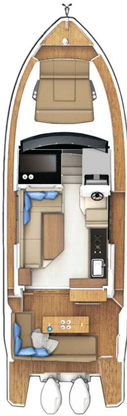
MAIN DECK optional with fixed cockpit table and extended bathing platform