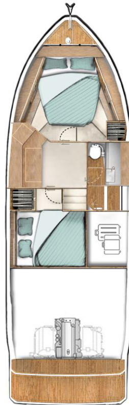
LOWER DECK Standard