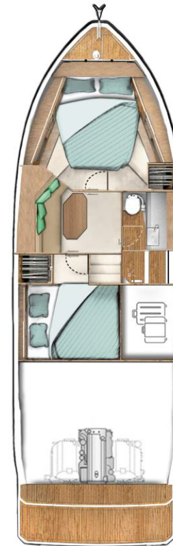
LOWER DECK Optional