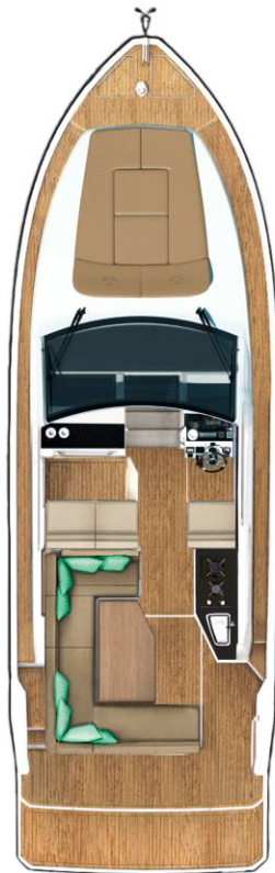
MAIN DECK mit erweiterter Badeplattform